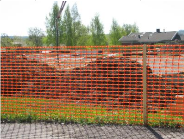
Kuva 3. Esimerkki työmaa-aidasta.

Työsuoritusta varten tarpeellisen alueen vuokraaminen ja aitaaminen ja portit sisältyy urakkaan. Aitaus tehdään n. 2m korkeana puurunkoisena työmaa-aitana, johon asennetaan oranssi muovinen tiheäsilmäinen työmaaverkko. Urakoitsija sijoittaa tarvitsemansa portit työmaa-aitaan parhaaksi katsomilleen paikoille. Myös metallista 2m verkkoaitaa voi käyttää.