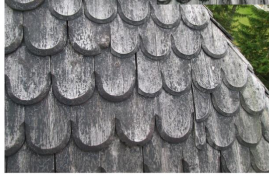
Paanukoon vaihtuminen toteutettu erikoisella tavalla lappeen reunan alueelle.

Lappeiden reuna-alueilla olevat paanukoon oma-peräinen paanujen vaihtotyö korjataan vain silloin, jos tällä alueella joudutaan vaihtamaan uusia paanuja.