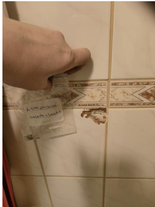
Kuva pesuhuoneen seinän näytteen otosta.