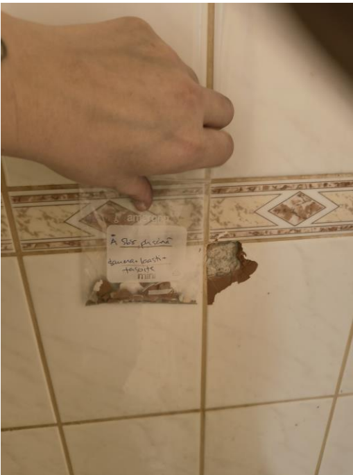
Kuva pesuhuoneen seinän näytteen otosta.