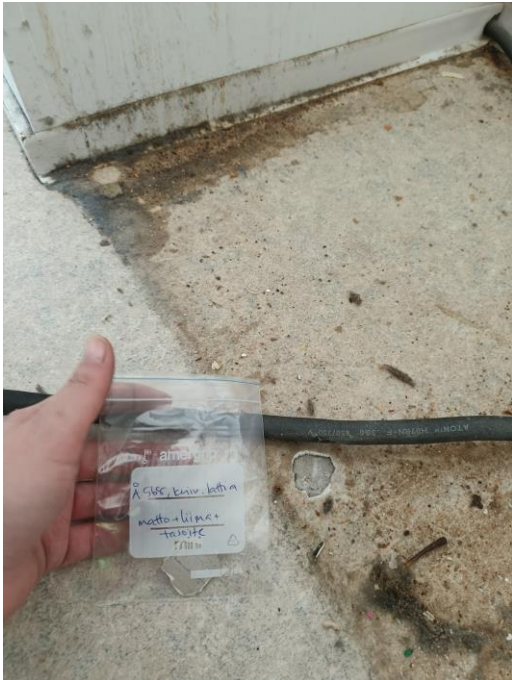
Kuva lattian näytteen otosta.