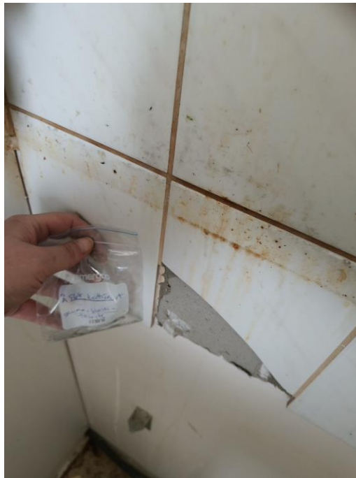
Kuva keittiön välitilan näytteen otosta.