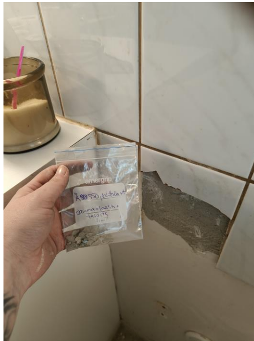
Kuva keittiön välitilan näytteen otosta.