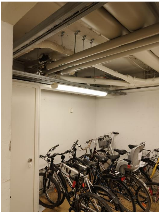
Yleiskuva pyöräkellarin uusista putkista.