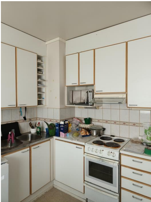
Yleiskuva asunnon keittiöstä.