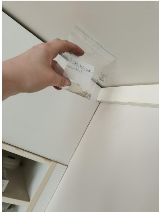
Kuva asunnon katon näytteen otosta.