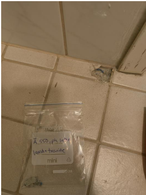
Kuva pesuhuoneen lattian näytteen otosta.