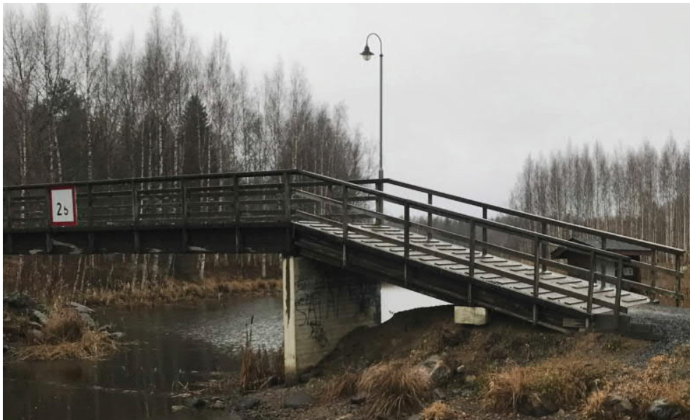
Kuva 1 Purettava silta

Nykyinen silta on tyypiltään 3-aukkoinen puinen palkkisilta, jonka pääjänneväli on n. 13,3 m ja hyötyleveys n. 3,0 m. Sillan kokonaispituus on 25,8 m. Sillan tarkka ikä ei ole tiedossa. Sillasta ei ole saatavilla vanhoja suunnitelmia.