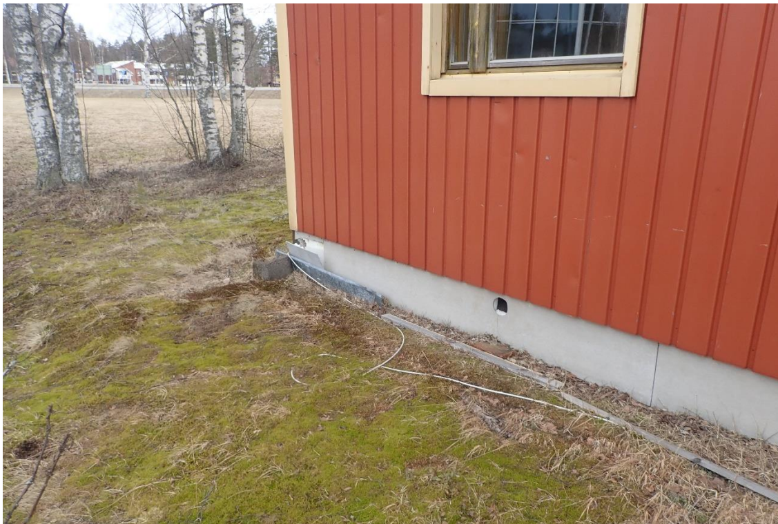
Kuva 4. Sokkelilevytyks sisältää asbestia.