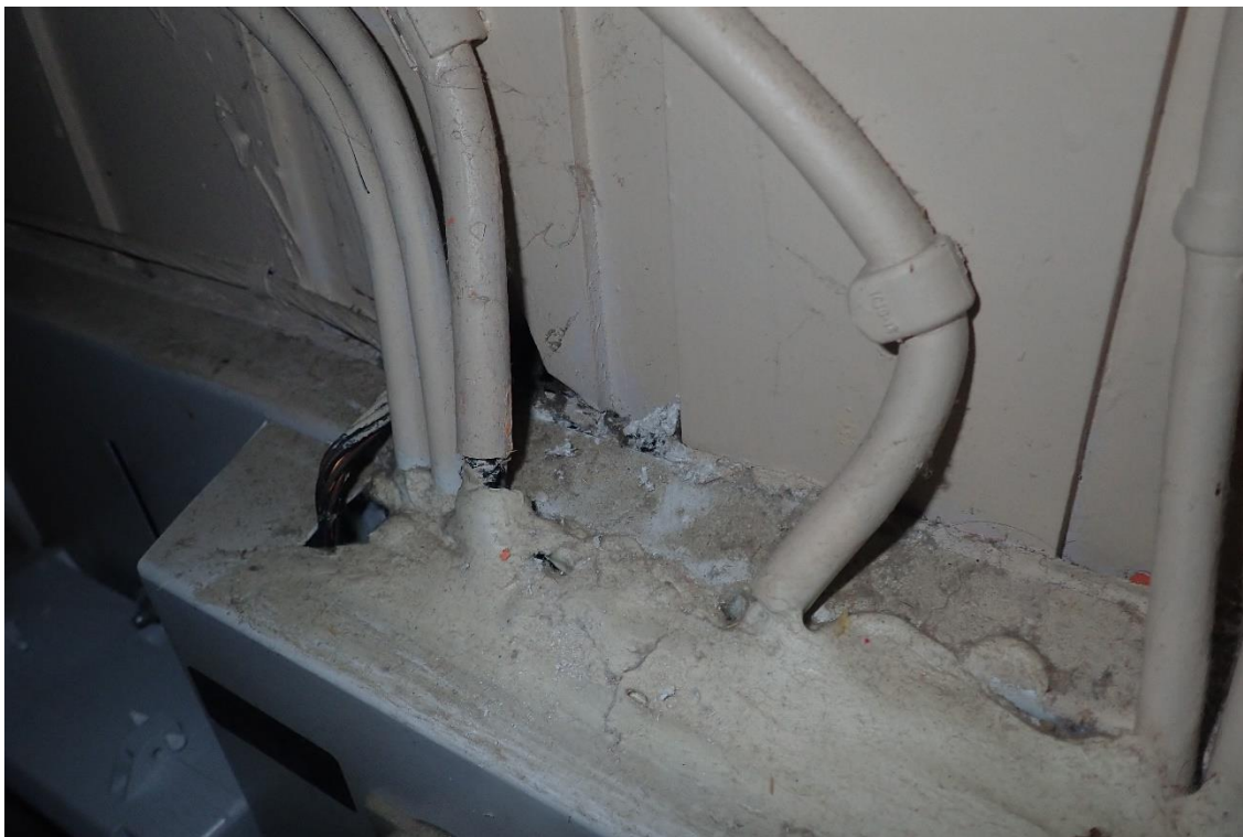
Kuva 2. Pahvilevy sähkökeskuksen takana sisältää asbestia.