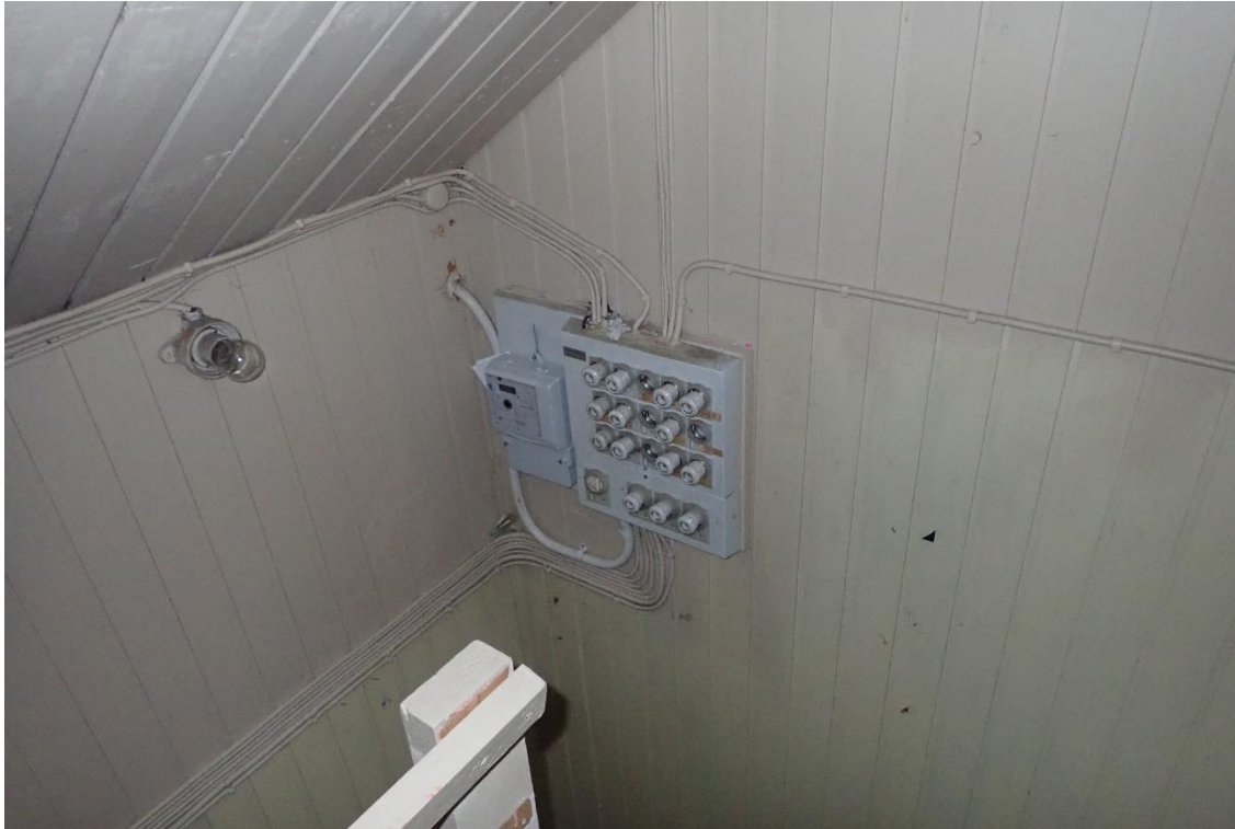
Kuva 1. Pahvilevy sähkökeskuksen takana sisältää asbestia.