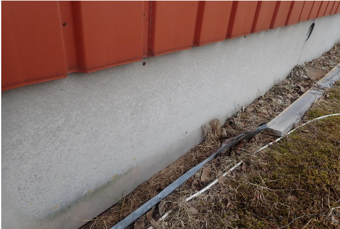
Kuva 3. Sokkelilevytyks sisältää asbestia.