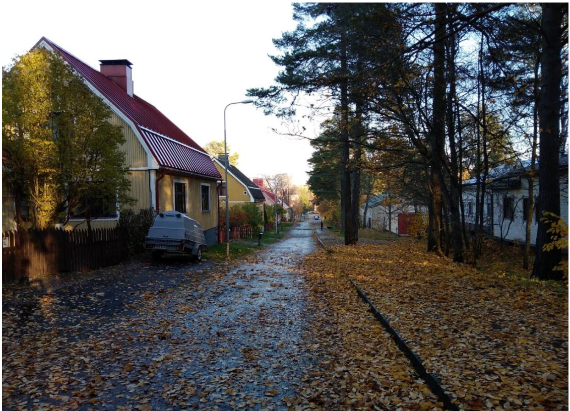
Kuva 2 Linnanpellon idyllistä paritaloaluetta Killisenkadulta itään. Kuvan oikeassa laidassa on Sokeainkoulun aluetta.

Kuopion kaupungin asutus alkoi voimakkaammin laajentua Linnanpellon alueelle 1800-1900-lukujen vaihteessa Savon radan rakentumisen jälkeen. Alueen vanhin rakennuskanta sijaitsee sokeainkoulun eteläpuolisessa Vuorelan korttelissa sekä sokeainkoulun alueella. Sokeainkoulun alueen pohjoispuolella avautuu tunnelmallinen puurakenteisten paritalojen alue, joka on rakentunut vuosien 1921-24 aikana.