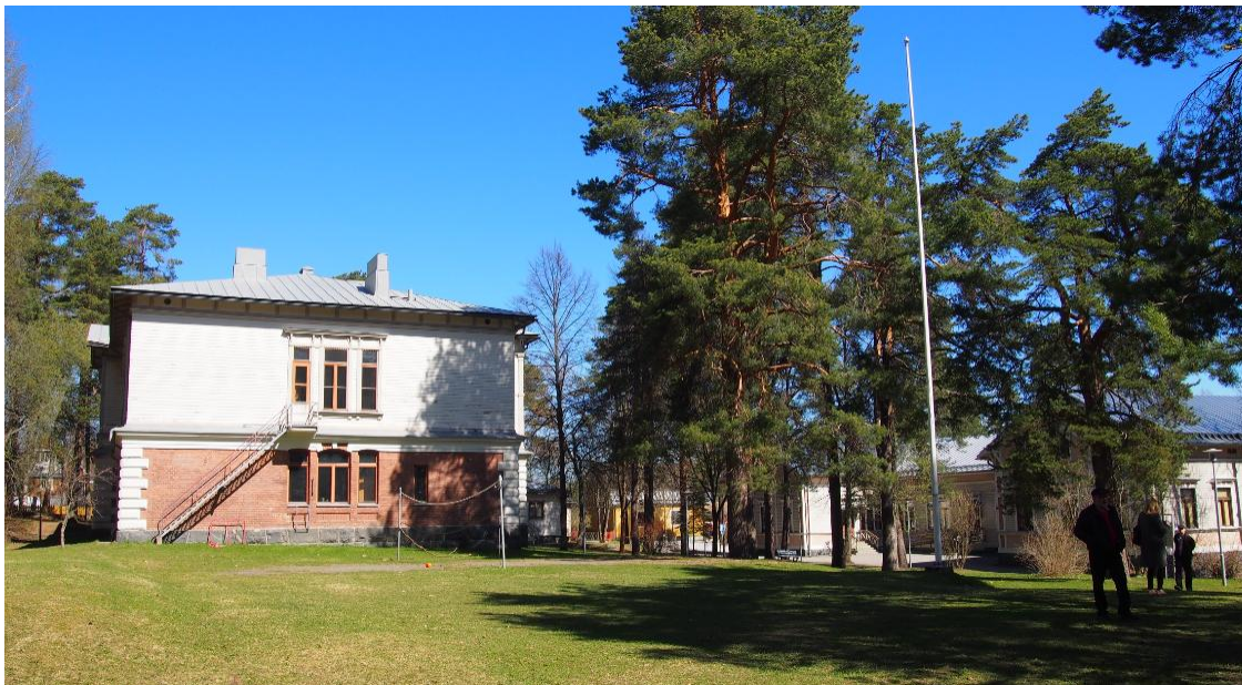
Kuva Sokeainkoulun vihreää ja puistomaista aluetta, vasemmalla koulu- ja käsityörakennuksen pääty, oikealla pilkottaa asuntolarakennus.

Sokeainkoulun rakennusten pihapiiri on idyllistä, vihreää ja puistomaista ympäristöä, jossa kasvaa mm. lehmuksia, vaahteroita, kuusia ja kookkaita vanhoja mäntyjä. Piha-alueella kulkee hiekoitettuja puistomaisia käytäviä rakennusten välillä.