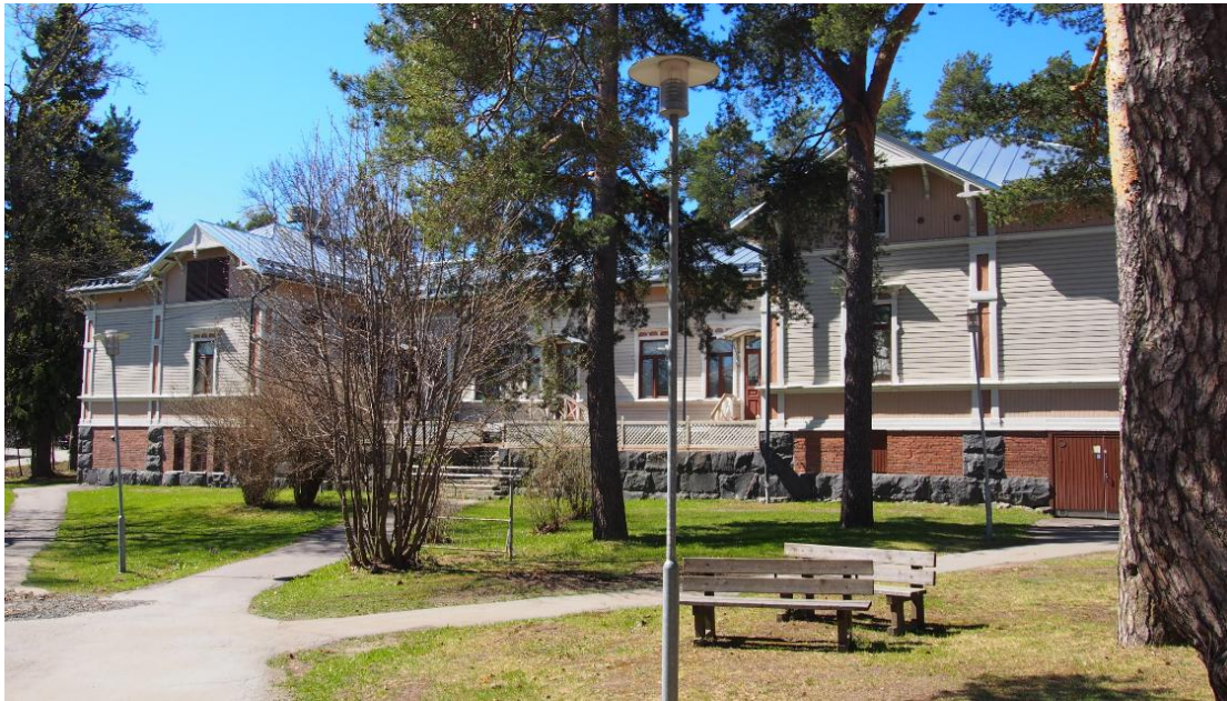
Kuva 4 Asuntolarakennus koillisen suunnalta.

Sokeainkoulun rakennusten pihapiiri on idyllistä, vihreää ja puistomaista ympäristöä, jossa kasvaa mm. lehmuksia, vaahteroita, kuusia ja kookkaita vanhoja mäntyjä. Piha-alueella kulkee hiekoitettuja puistomaisia käytäviä rakennusten välillä.