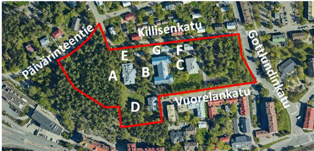
Kuva 3 Suunnittelualueen likimääräinen rajaus sekä sokeainkoulun alueen rakennukset.

Sokeainkoulun alueen rakennukset ovat pääosin puurakennuksia. Koulu- ja käsityörakennuksessa sekä sauna- ja pesutuparakennuksessa on käytetty myös tiiltä. Rakennusten julkisivuista on löydettävissä useita tyylejä, mm. koulu- ja käsityörakennuksesta uusrenessanssin tyyli-irteitä ja puurakennuksista uusgotiikan sekä nikkarityylin koristeaiheita.