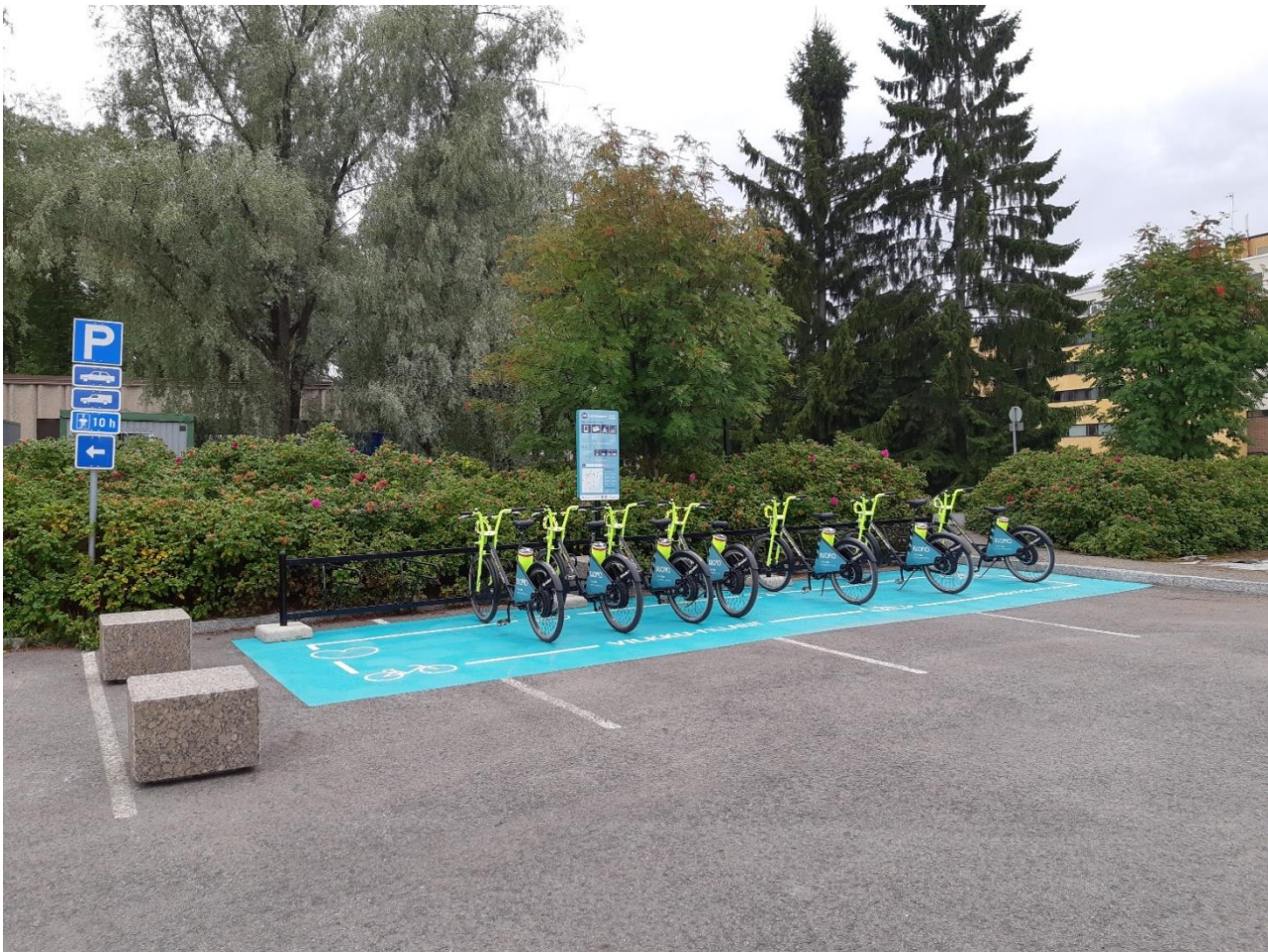
Esimerkki kalustetusta ja maalatusta "Decomark"-asemasta (Väinölänniemi).

Kaupunkipyöräasemia Kuopiossa on tällä hetkellä yhteensä 47. Asemista 10 on ns. Decomark-asemaa, joille on rakennettu pyörätelineitä, katukalusteita ja katumaalaus. Muilla asemilla asemaa merkitsee tolppa ja infotaulu. Kaikki asemat ovat virtuaalisia, eli pyöriä ei tarvitse fyysisesti lukita asemien rakenteisiin. Riittää, että asiakas jättää pyörän asemalle. Pyörän sijainti tunnustetaan GPS:n avulla.