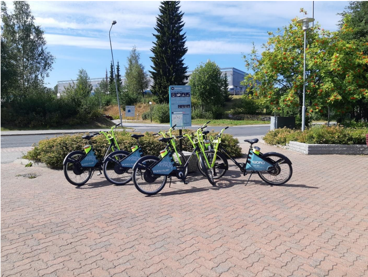
Esimerkki tavallisesta asemasta (Särkiniemi).